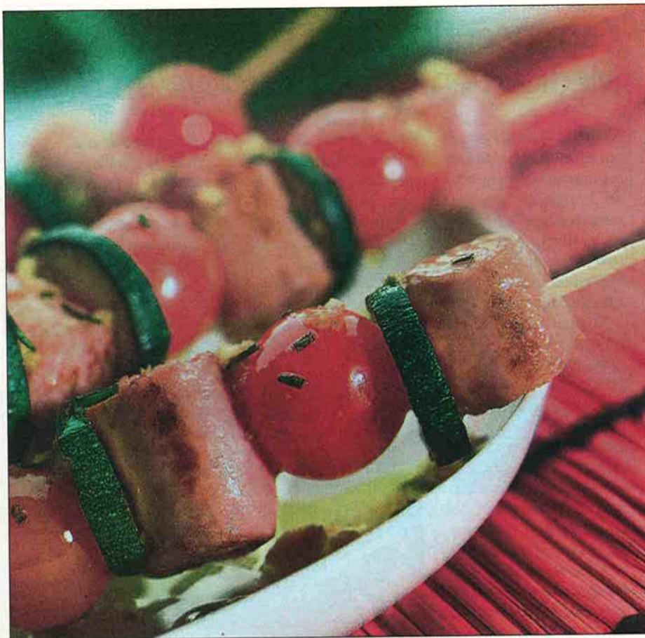
Los sabores y olores agradables con texturas variadas ayudan a comer al enfermo de paliativos.

Para dar ideas a familiares y cuidadores,