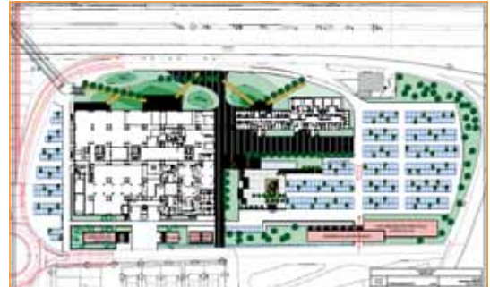
Zona d'aparcament i jardí