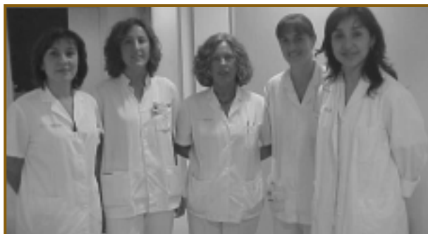
Infermeres de les Unitats Funcionals

Els bons resultats obtinguts fins ara han fet possible dissenyar uns nous espais pensats arquitectònicament i funcionalment per respondre a les necessitats dels pacients i dels professionals que hi treballen, per aconseguir fer les coses més fàcils per a tots. Aquesta realitat s'iniciarà a primers d'octubre i estarà ubicada a la planta segona de l'edifici petit.