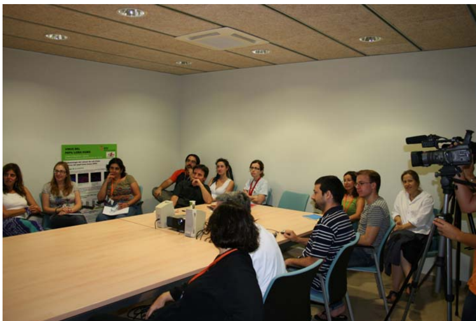
S'ha habilitat una sala a l'ICO per seguir el webinar